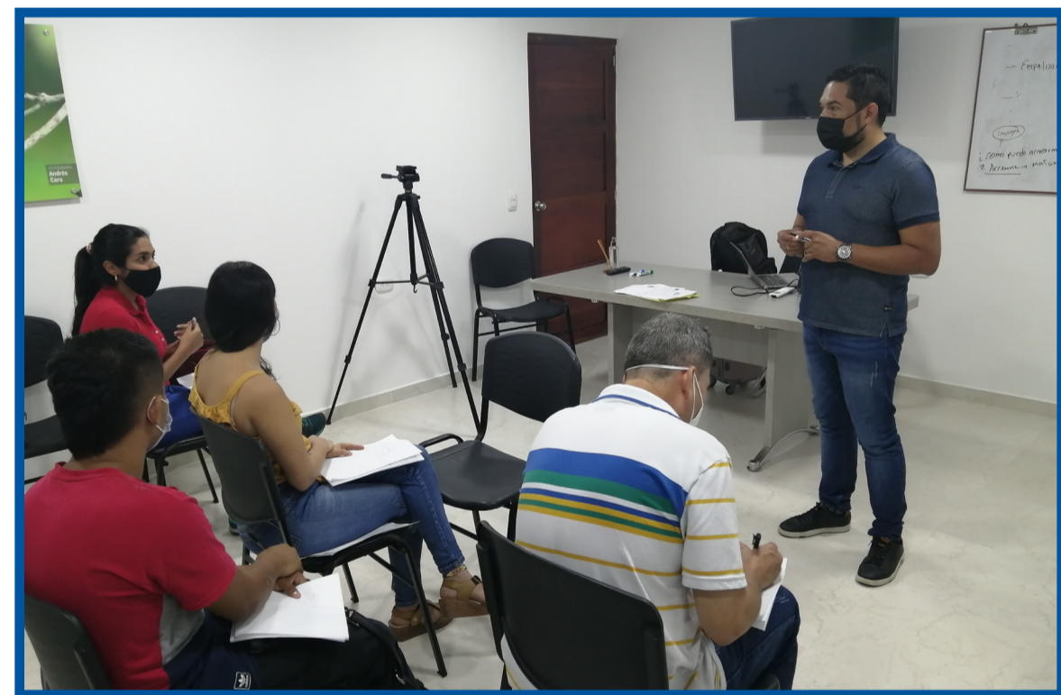
Reto Emprender+ Componente Empresarial San Martín

Gracias a la alianza estratégica entre Scotiabank , Gran Tierra Energy y Créame Incubadora de Empresas , inicia el componente de Reto Emprender+ el cuál busca generar cultura emprendedora en la población de los territorios de interés.